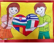
Workshop for students...